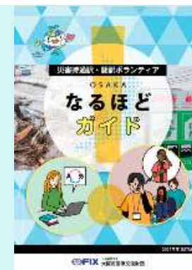
災害時通訳・翻訳ボランティア ガイドブック