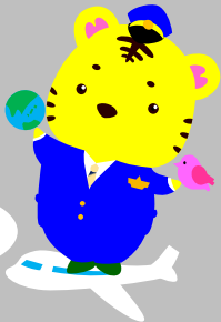
大阪入管マスコット えんトラくん