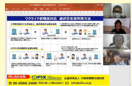
《避難民通訳人材バンクのオンライン連絡会議》