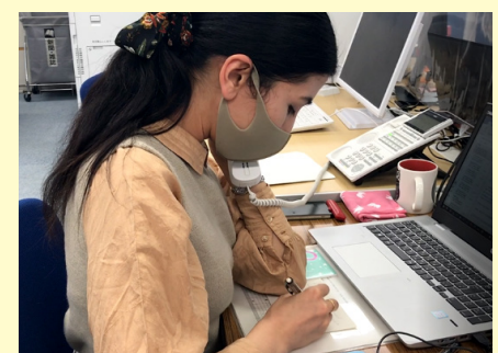
《避難民からの相談電話対応中》