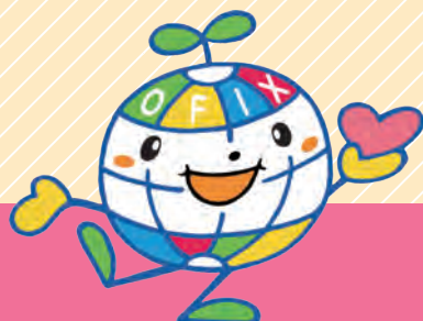
OFIX 公式キャラクター ボラちゃん

ます。日本語の壁、生活風習・文化等を分かりやすく、また災害時における緊急対応の情報発信・問い合わせの応答など、「おもてなし」の心を忘れず、安心して滞在・学べる・生活できる日本をアピールしていきたいと、今年も職員一同心を一つにして頑張っていく所存でありますので、皆様の更なるご理解とご協力をお願い致します。