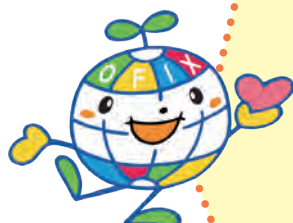
OFIX 公式キャラクター ボラちゃん