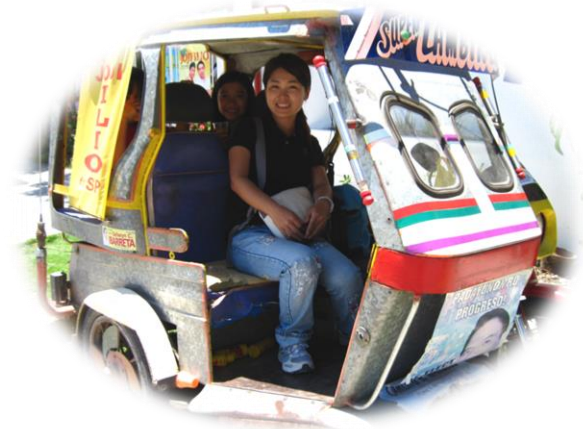
フィリピンの乗り物トライシクル (リヤカー付きオートバイ)に乗る私

これから国際協力の分野で活躍する大阪人を発掘し、みなさまに発信していきたいと思っておりますので、よろしくお願ひします。また、JICA の事業や国際協力について疑問・質問等がありましたら、お気軽にお声かけください。