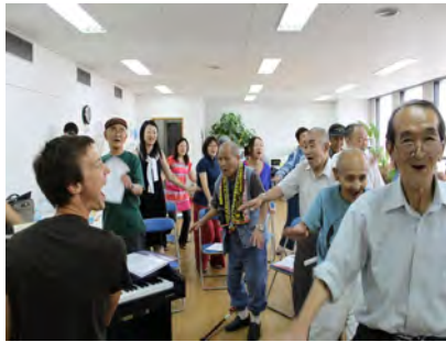
大阪・釜ヶ崎でのワークショップ

関西地区での昨年の活動を一部ご紹介します。アート分野では、音楽を通してホームレスの自立を促す活動をしている英国の団体を招聘し、大阪・釜ヶ崎にてアート NPO との協働でワークショップやセミナーを実施。同じく大阪では、子供向け科学実験講座を開催し、英国の一流の講師陣が小・中学生向けに科学への楽しい