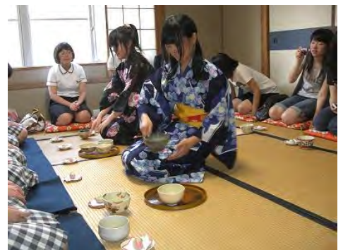
東高等学校茶道クラブとの交流