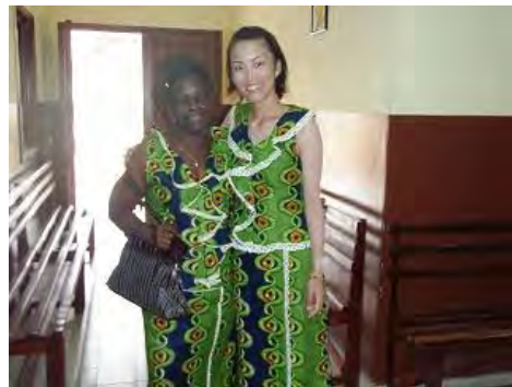
活動先のスタッフとお揃いの民族衣装で。彼女は、私のガボンの母のような存在です！