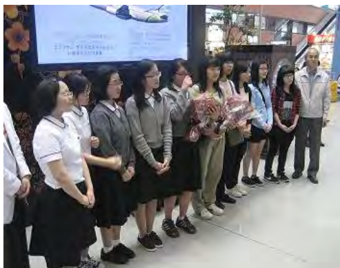
関西国際空港での歓迎セレモニー

最終日には朝から、大阪城を観光し、天守閣に上がったり、鎧をかぶったりと皆、日本の江戸時代の雰囲気につれ、非常に喜んでいました。その後西日本一の高さを誇るWTCコスモタワーの48階、地上200メートルのレストンワールドビュッフェで昼食を味わい、その後海遊館で大いに楽しみました。その後関西国際空港に向かい帰国の途につきましたが、全員「まだ帰りたくない」、「大阪が大好きになりました」、「絶対又大阪に留学したい」、「又観光で来たい」と名残惜しそうに釜山に帰って行きました。今回の事業を通じて、若者同士の交流の大切さ、相互理解の大切さを非常に感じました。今後も同様の事業を行いたいと思っています。