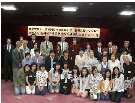
歓迎レセプション