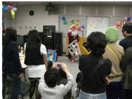
マジックショーにて

続いて、ロシアとブラジルの留学生によって情熱的なダンスを披露してもらいました。最後に、留学生の企画によるビンゴゲームなどを楽しみました。賞品は、もともと生活に大事なものとなる石鹸や洗剤などでした！とても楽しく、有意義な交流会となりました。次の交流会は12月に開催する予定です。