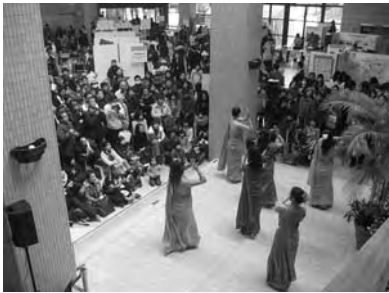
ワンワールドフェスティバル

今年で17回目を迎えるこのイベントは、関西に拠点を置く100団体以上のNGO・NPOや国連機関、企業などが一同に会し、府民に広く国際協力の大切さを認識してもらうため、「感じる・ふれあう・助け合う」をテーマに、各団体の活動紹介、シンポジウム、ワークショップ等を行う、世界につながる国際協力のお祭りです。