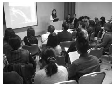
OFIX アジア留学生フォーラム

2日間にわたるフェスティバルの参加者は14,500人で、参加団体も、相互の情報交換、ネットワークづくりができるなど、非常に意義深いイベントとなりました。