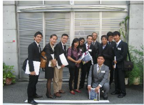
安藤忠雄氏表敬訪問

的でした。最近では、安藤氏がガラスの壁や広い空間などの新しい方法を取り入れています、建築への熱意が非常に高いと感じます。