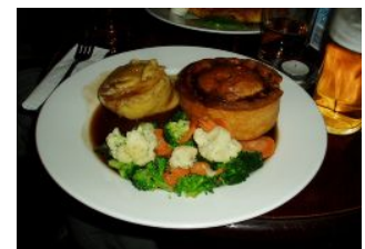
お気に入りのパブランチ

とにかく、この時期はどこにいても楽しく過ごす事ができると思います。読者のみなさんも宴会を大いに楽しんでください！