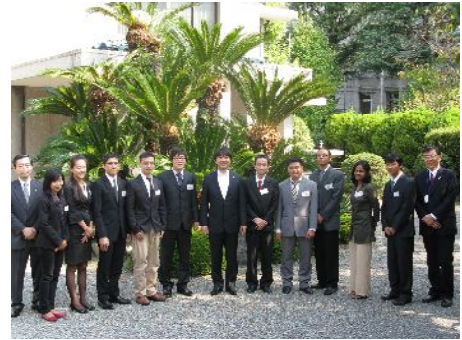
橋下知事表敬訪問

安藤氏が若い頃に設計したビルは、非常にルイス・バラガン氏(メキシコ出身の建築家)の影響が強いと思いました。空間や光のデザインや、コンクリートと水の使い方は特に印象