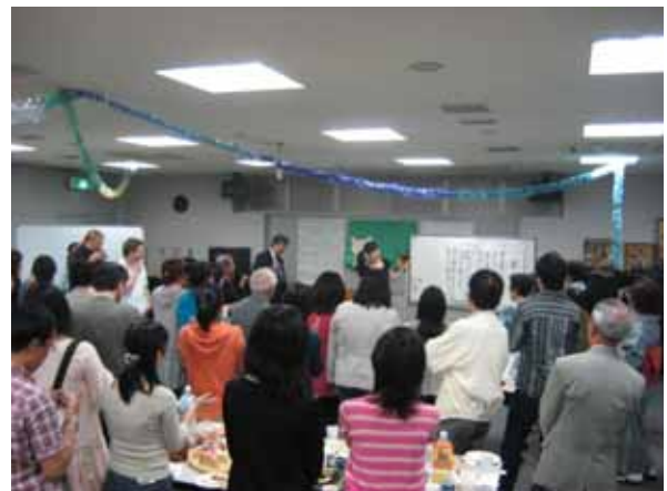
日本の歌を教わる留学生

最後に、留学生の企画による絵書ゲームなどを楽しみました。賞品は、もっとも生活に大事なものとなる石鹸や洗剤などでした！とても楽しく、有意義な交流会となりました。